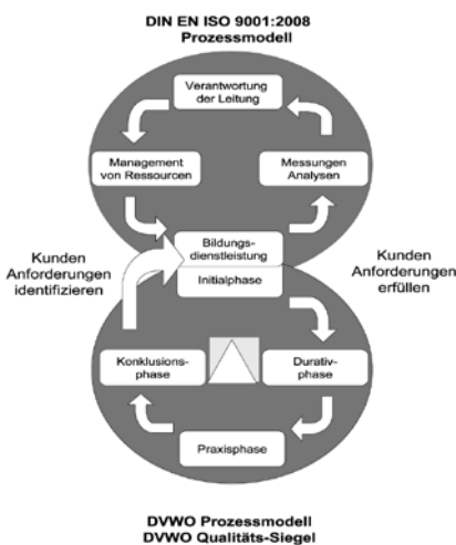
Abb. 1: DVWO-ProzessAcht

weiter aus. Die messbaren Qualitätskriterien bilden zusammen mit den Grundsätzen und Richtlinien des DVWO Qualitäts-Siegels das Rückgrat des DVWO Qualitäts-Systems, dargestellt in der ProzessAcht (Abb. 1). Das DVWO Qualitätssiegel schafft einen fließenden Übergang von der DVWO-internen Prüfung zur externen Zertifizierung nach ISO bzw. AZWW.