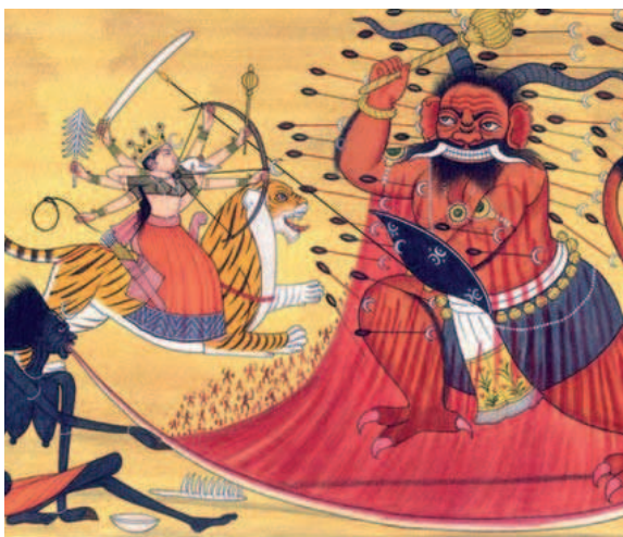
Dämon Raktabija, Brooklyn Museum